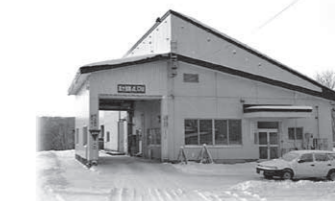
[計量棟・ 受付事務所]

スプリングマットレスなどの変更点を含む、新しい『ゴミ分別表』は、3月下旬頃から担当窓口にて配布いたします。