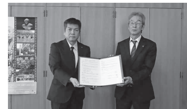
総務課総務財政室