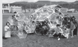
2021.11 「Otoineppu Pavillion 2021」 小目標：協働での創作活動を通して、高校生や村民との交流機会づくりの試行