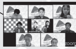
2022.3.20 ソフト/ハワード 2021 小目標：まちづくりコンテスト参加による、プロジェクト成果の振り返りと情報発信