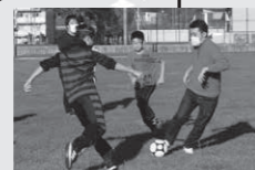
2021.10~11 学生滞在① 小目標：対面での村民との交流から、互いに新たな視点や村の魅力に気付くきっかけづくり