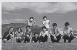
2022.8 学生滞在② - 1 小目標：継続性を目指した新たな学生誘致と、子どもたちの社会教育機会づくり