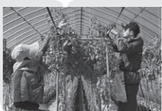
2022.9 学生滞在② - 2 小目標：主要産業を中心とした地域内外との交流機会づくりの試行

2023.1~3 小目標：ICT（情報通信技術）と地域資源を活用した、交流の機会づくりの試行