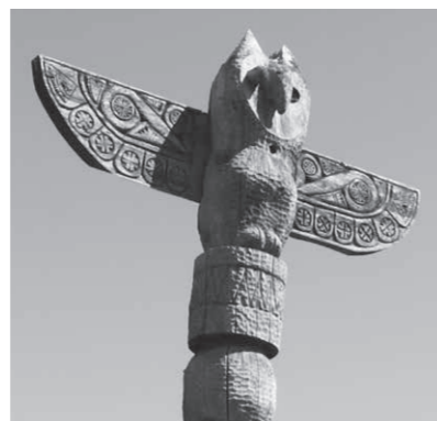
左：エゾシカのポール（中央）、キツツキのポール（右）の後を追うように、フクロウのポール（左）も折れてしまいました 上：最後まで形を留めていたフクロウのポール。特徴的な文様が随所に