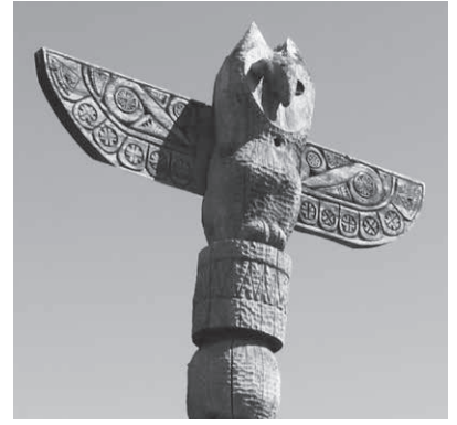
左：エゾシカのポール（中央）、キツツキのポール（右）の後を追うように、フクロウのポール（左）も折れてしまいました 上：最後まで形を留めていたフクロウのポール。特徴的な文様が随所に

4月21日（火）、北大中川研究林庁舎前に建立されている3本のトテムポール「思考の鳥」のうち、最後の1本が強風にあおられ倒壊しました。倒壊したのは夕方6時35分ごろで、怪我をした人はいませんでした。しばらくの間は、倒壊した状態のまま展示し、形が残っているフクロウの羽の部分については、研究林での展示が検討されているとのことです。 「思考の鳥」は、彫刻家・砂澤ビツキさんが、研究林（当時：演習林）庁舎落成を記念して制作、昭和56年に建立されました。3本のポールの上端にはそれぞれエゾシカ（中央）、キツツキ（右）、フクロウ（左）があしらわれていましたが、平成16年に中央のポール、平成22年・27年に右のポールが壊れ、原型を留めていたのは左のポールのみとなっていました。 ビツキさんは、「自然は、ここに立つ作品に風雪という名の鑿（のみ）を加え続ける」との言葉を残しています。強風によって刻まれた鑿の跡を、ビツキさんほどのような思いで見つめているのでしょうか。