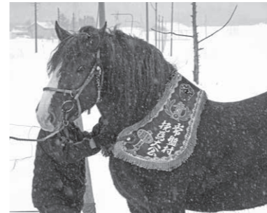
[常盤村馬大会優勝レイとばん馬]

北海道の歴史には欠かせない「馬」。開村間もない頃から、人々の生活とともに馬も活躍してきました。 北海道大学中川研究林から村に寄贈いただいた「常盤村馬大会」と書かれた郷土史料は、同大学吉小牧研究林に所蔵されていたそうです。どのような経過があったかは不明ですが、旧村名「常盤村」が記されていることから、本村の歴史にゆかりのある史料であることが読み取れます。 村と馬の歴史を遡ると、村内農家に馬が導入され始めたのは明治末期のこと。大正時代には約200頭、最も多いのは昭和30年で334頭にのぼりました。夏は農耕や物資運搬、馬回し式のでんぷん製造工場の動力、冬は林業(丸太の運搬)、砂利や除排雪運搬にと、馬なくして人々の生活は成り立たないほどに重要な存在でした。 昭和30年頃、村内北線地区にあった切割山に牛懸碑が建ち、地鎮祭の余興として村内農耕馬による馬競争が催されるようになり、音威子府大橋左岸北側付近で、昭和33年から39年頃まで開催されました。区分別レース、障害競走、重量挽き、地区別対抗リレー、村外馬を含めたレース等、数十頭・十数レースが開催され、千人以上の観衆で賑わったそうです。優勝旗目指した愛馬の競争に家族ぐるみで応援し、レースが終われば愛馬を労わる姿が見られたそうです。人と馬との距離感がうかがい知れます。 約60年前の賑わいを彩った「優勝レイ」。村内茨内地区に居るばん馬に装着させていただき、当時の雰囲気再現してみました。