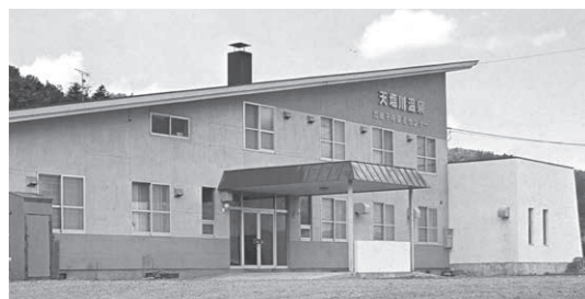
〔開業時の天塩川温泉 / 昭和48年〕

源泉である「常盤鉱泉」は、ウッカヤタンナイ沢に自然湧出している鉱泉（冷泉）で、アイヌの人々が古くから効能があることを知っていたとされ、大正時代に改めて発見されました。昭和初期には、旭川市にあった常盤鉱泉商會が分析鑑定と販売許可を行い「常盤鉱泉」の名称で、内服で効能がある飲用薬として販売されていたこともありました。