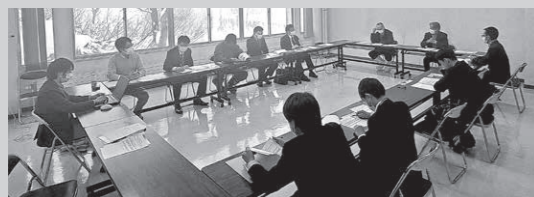
☎ 総務課地域振興室