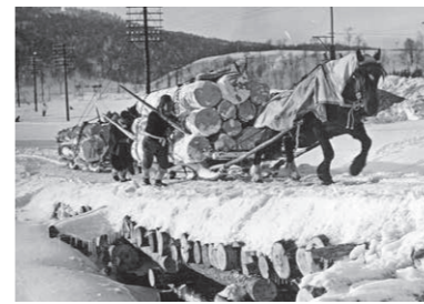
[冬山造材で活躍する馬/昭和30年代頃] *写真後ろの低い山が北線地区「切割山」