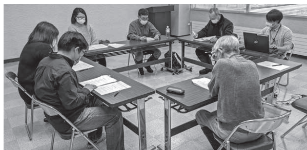
問 協議会事務局（総務課地域振興室） ☎ 5 - 3311