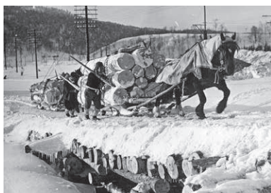
〔冬山造材で活躍する馬/昭和30年代頃〕 ※写真後ろの低い山が北線地区「切割山」

約60年前の賑わいを彩った「優勝レイ」。村内茨内地区に居るばん馬に装着させていただき、当時の雰囲気を実現してみました。