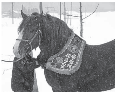
〔常盤村靉馬大会優勝レイとばん馬〕