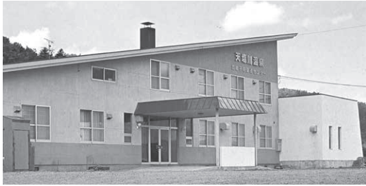
〔開業時の天塩川温泉 / 昭和48年〕

源泉である「常盤鉱泉」は、ウッカヤタンナイ沢に自然湧出している鉱泉（冷泉）で、アイヌの人々が古くから効能があることを知っていたとされ、大正時代に改めて発見されました。昭和初期には、旭川市にあった常盤鉱泉商会在が分析鑑定と販売許可を行い「常盤鉱泉」の名称で、内服で効能がある飲用薬として販売されていたこともありました。